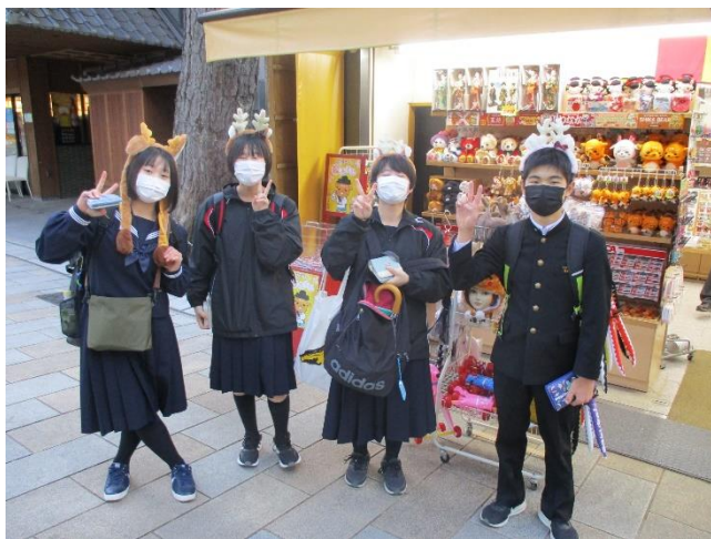
お土産を買う時間も十分に確保できました！