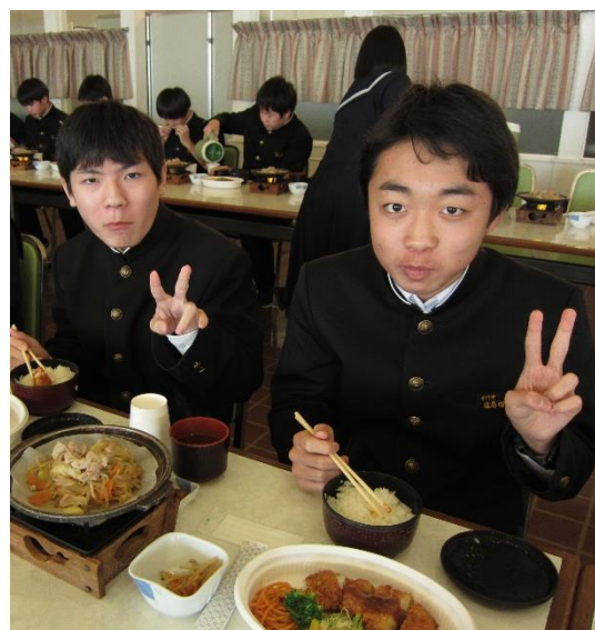
食事は感染症対策が十分にとられた場所で!