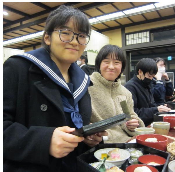
2日目は、タクシー別見学です！ 自分たちでコースを作成し、京都の町を巡りました。