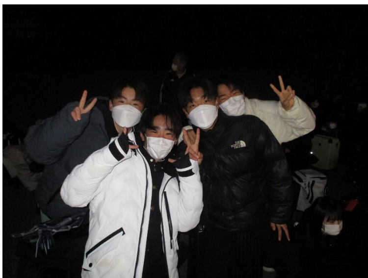
出発は朝6時30分!暗闇の中での出発式となりました。