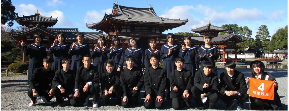
4コースは平等院鳳凰堂を訪れました！！